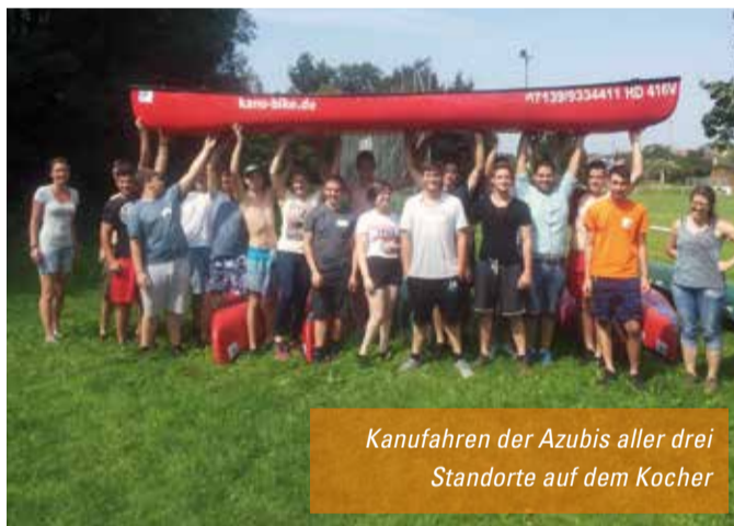
Kanufahren der Azubis aller drei Standorte auf dem Kocher