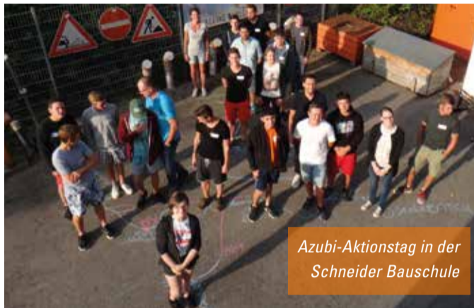
Azubi-Aktionstag in der Schneider Bauschule